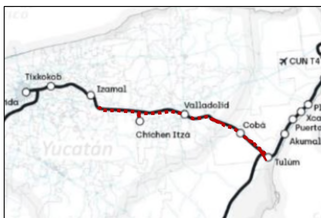
Ilustración 2. Trazo del Tramo.

El Tramo objeto del presente Contrato, va desde el Km 76+000 de la Carretera Federal 180D de Kantunil, Estado de Yucatán, hasta la “Estación de Tulum”, en el Estado de Quintana Roo, recorriendo una longitud de línea principal de 174.9 (ciento setenta y cuatro punto nueve) kilómetros, del PK 641+100 al 816+000, y un ramal para conectar a la estación de Chichen Itzá con una longitud de 7.2 (siete punto dos) kilómetros, obteniendo una longitud total para el tramo de 182.1 (ciento ochenta y dos punto uno) kilómetros, conforme al trazo preliminar.